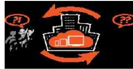
6. მმართველობა და საერთო დანიშნულების ხარჯები.

სწორედ ამ მიმართულებების გათვალისწინებით შემუშავდა მუნიციპალიტეტის ბიუჯეტიდან დასაფინანსებელი ძირითადი პრიორიტეტები და პროგრამები, რომელიც ასახავს საკუთარი უფლებამოსილების ფარგლებში იმ პრობლემების გადაწყვეტის მიზნით გასატარებელ ღონისძიებებს, რომელიც ყველაზე აქტუალურია საზოგადოებისათვის. ეს არის გზა, რომელიც უზრუნველყოფს მუნიციპალიტეტისათვის აქტუალური ყველა საკითხის სისტემურ გადაწყვეტას, შემოსავლების ზრდას და საცხოვრებელი გარემოს არსებით გაუმჯობესებას და თვისებრივ გარდატეხას შეიტანს როგორც, მუნიციპალიტეტის, ისე ქვეყნის ეკონომიკაში, რაც ახალი, სწრაფი განვითარების ეტაპის დაწყების საწინდარი გახდება.