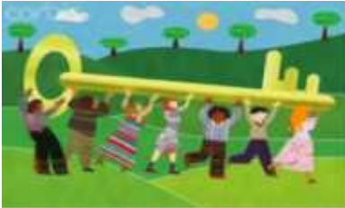
4. კულტურა, რელიგია, ახალგაზრდობა და სპორტი.