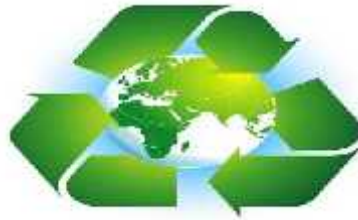
2. დასუფთავება და გარემოს დაცვა.