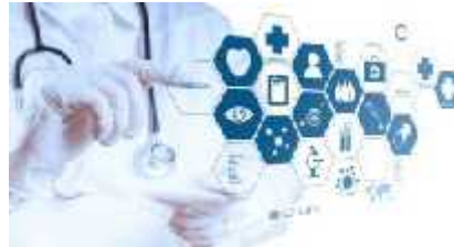
5. მოსახლეობის ჯანმრთელობის დაცვა და სოციალური უზრუნველყოფა.